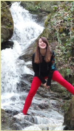
A HÉT FOTÓJA: Ami a