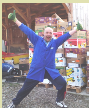
A HÉT FOTÓJA: A boldog