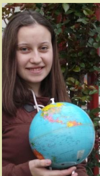
A HÉT FOTÓJA: A FÖLD napja

A Föld napja alkalmából különféle eseményeket rendeznek világszerte, melyekkel felhívják a figyelmet a Föld természeti környezetének megóvására.