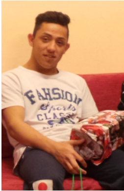
Das beste Foto dieser Woche: Er selbst hat ein Geschenk für die Geburtstagsgeschwister vorbereitet.

Die Holzindustrie Schweighofer hat unserem Heim in diesem Winter mit Wärme und elektrischer Energie aus Pellets geholfen. Insgesamt wurden drei LKW-Ladungen von Pellets im Wert von 15 Tausend Euro geliefert.