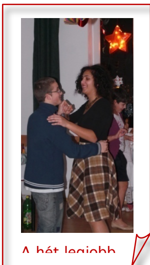
A hát legiohb

Sikerekben gazdag, békés, boldog új Eszteudöt kívánunk minden nálunk nevelkedett és nevelkedő gyermeknek és fiatalnak, minden munkatársnak és mindazon barátoknak, ismerősöknek, támogatóknak, akik