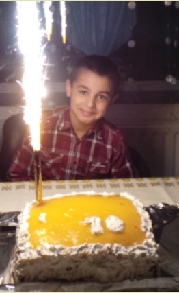
A HÉT FOTÓJA: Máriaus a boldog születésnapján

"A tegnapokkal fogy az élet, A holnapokkal egyre nő, S szemedben mégis mindörökké, A mának arca tűn elő - Ezért ha illan ez az év is, S a múltba szállva szétomol, Lelkedben ott a kincs örökre Amely valaha benne volt."